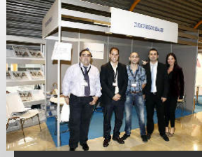
Colegio de Abogados de Málaga