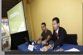
Sección de Consumo