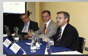
Sección de Responsabilidad Civil