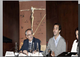
Sección de Procesal