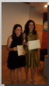
Alumnas del Máster premiadas