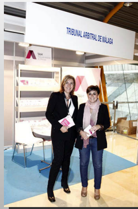
Tribunal Arbitral de Málaga