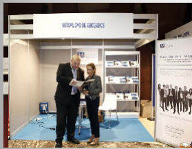
Mutualidad de la Abogacía