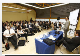
Sección de Gestión de Despachos