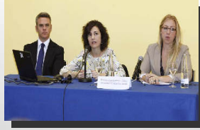
Sección de Administrativo