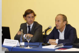
Sección de Deportivo