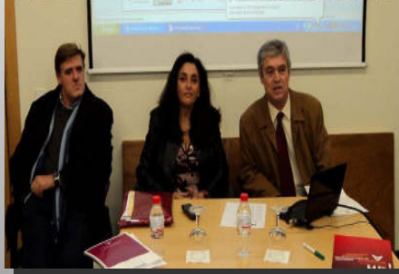
Jornadas sobre Mediación Familiar