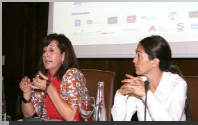
Sección de Menores