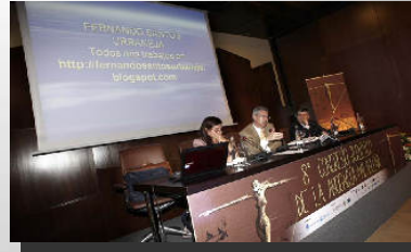
Sección de Diversidad Funcional