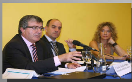
Sección de Urbanismo