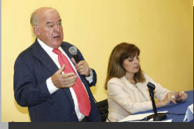
Sección de Laboral