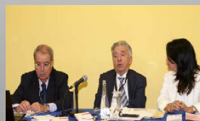
Sección de TAM