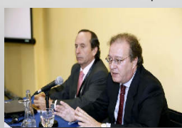
Sección de Propiedad PH y AU