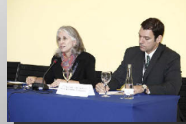
Sección de Internacional