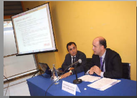
Sección de Mercantil