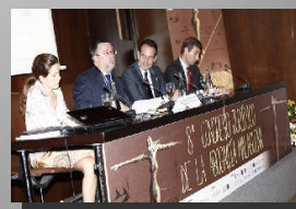
Sección de Penal