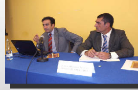
Sección de Concursal