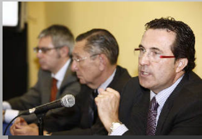
Sección de Prevención de Blanqueo de Capitales