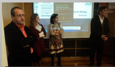
Entrega de Títulos de experto, se entregaron un total de 156