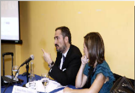
Sección de Tributario