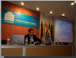
Curso de Extranjería