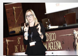
Sección de Mediación