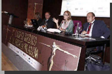
Sección de Dº Familia