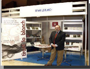
Tirant Lo Blanch