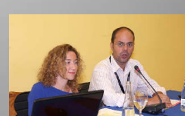
Sección de Extranjería