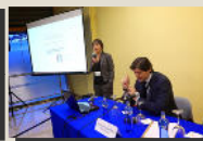
Sección de Gestión de Despachos