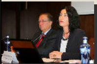
Sección de Dº Familia