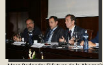
Mesa Redonda: El futuro de la Abogacía