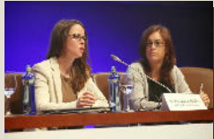
Subcomisión de Extranjería del Turno de Oficio