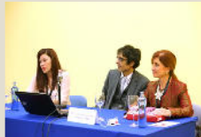
Grupo de Abogados Jóvenes