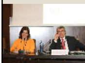
Sección de Urbanismo