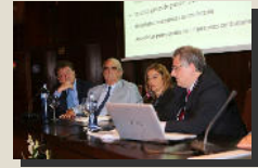
Mutualidad de la Abogacía