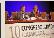
Sección de Derecho Bancario