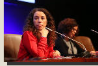
Subcomisión de Violencia de Género del Turno de Oficio