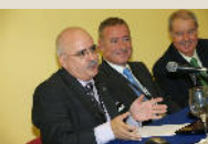
Sección de Tribunal Arbitral de Málaga