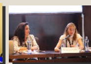
Sección de Mediación