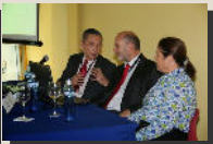
Sección de Prevención del Blanqueo Capitales