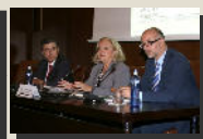
Sección de Dº Penal