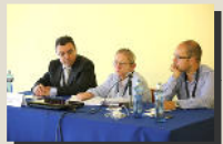
Sección de Diversidad Funcional