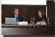
Sección de Dº Tributario