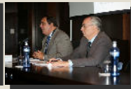
Sección de Dº Procesal