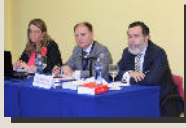
Sección de Dº Mercantil