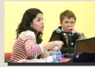
Comisión Derechos Humanos