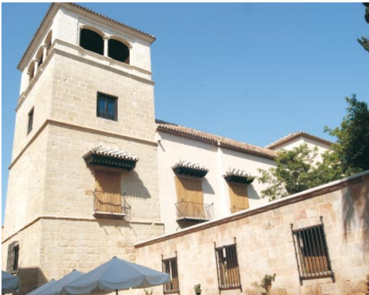
Arriba: Museo Picasso Málaga; abajo: Museo Picasso Barcelona