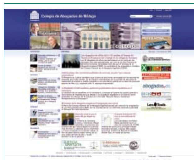
Nuevo diseño de la web colegial