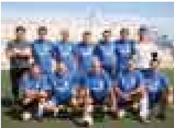
Equipo de Policía Nacional

que debíamos encarar el siguiente encuentro contra el combinado formado por Jueces-Fiscales-Funcionarios sin margen de descanso, debido a lo apretado del calendario. Aquel factor unido al escaso número