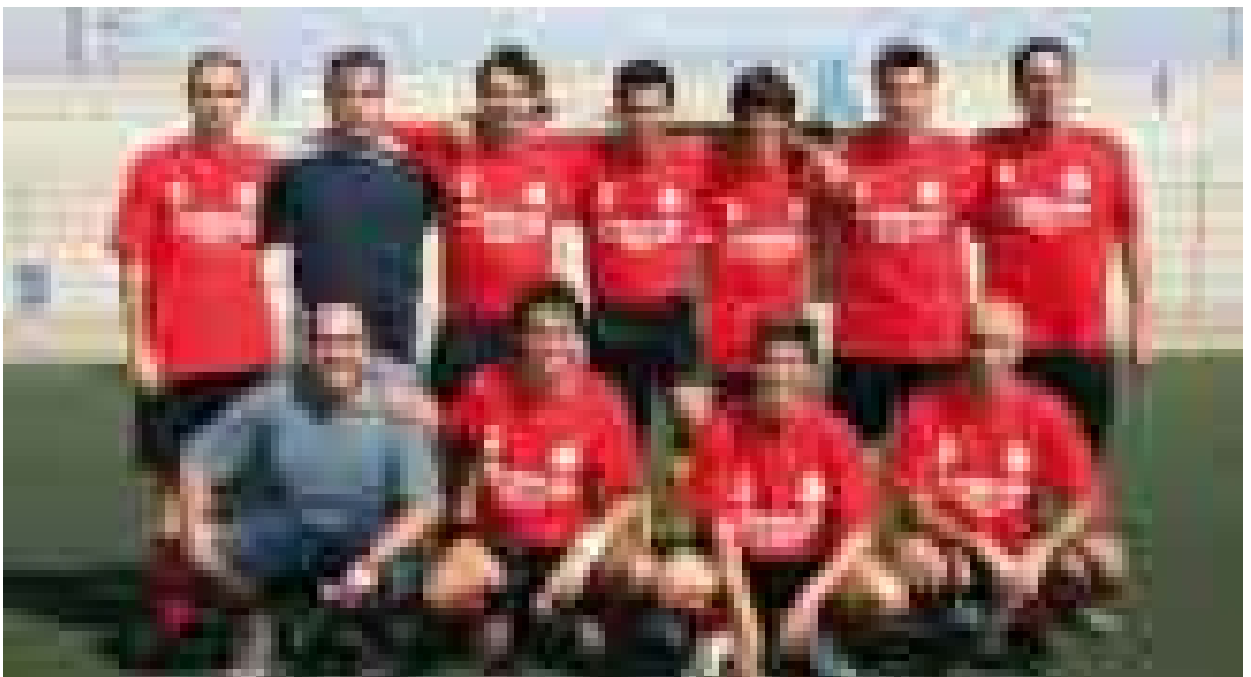
Equipo del Colegio de Abogados

La pérdida de aquel partido, supuso un duro golpe anímico en nuestras aspiraciones y, lo peor,