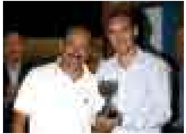
Entrega de trofeos

sucumbimos a las fauces del plantel judicial, perdiendo el mismo por el resultado de 1-3.