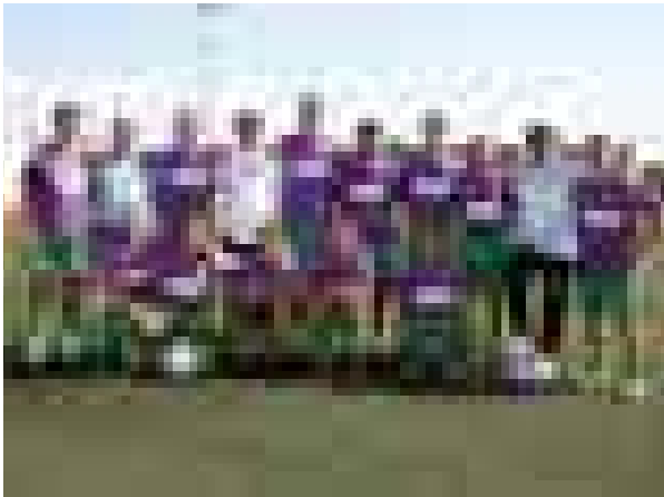
Equipo de graduados sociales.

que debíamos encarar el siguiente encuentro contra el combinado formado por Jueces-Fiscales-Funcionarios sin margen de descanso, debido a lo apretado del calendario. Aquel factor unido al escaso número