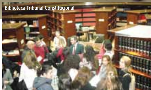
Biblioteca Tribunal Constitucional