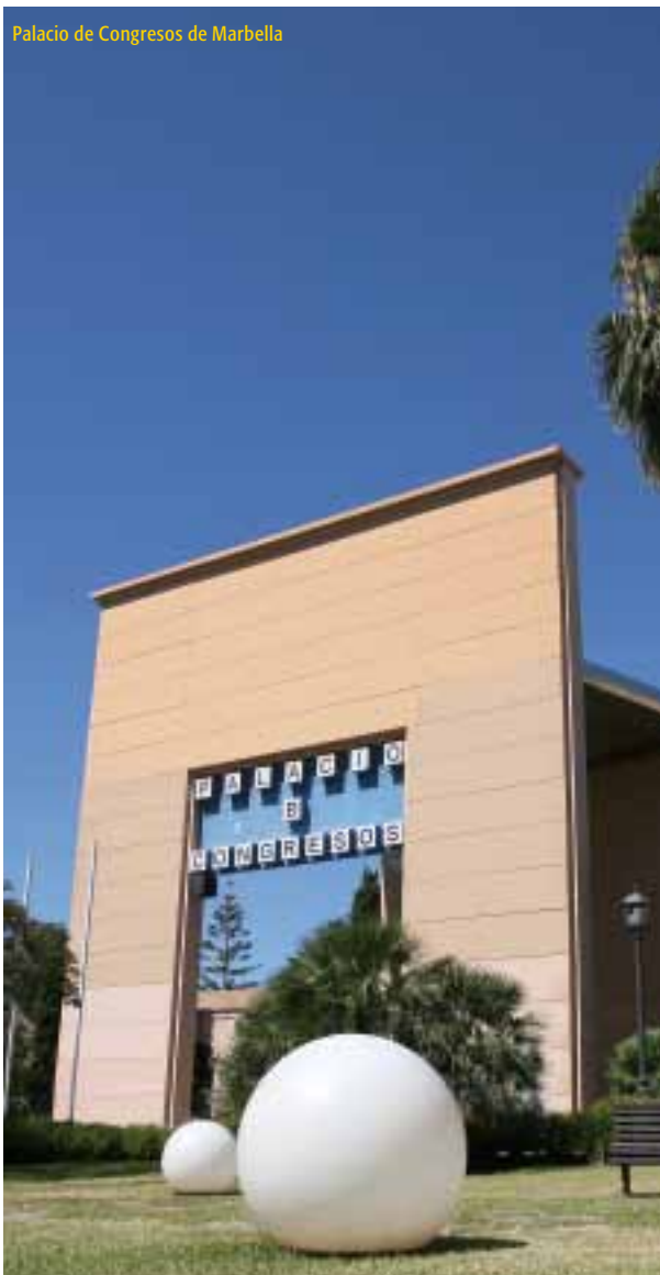
Palacio de Congresos de Marbella

que tienen repercusión en familia, no solo desde la perspectiva de violencia de género, sino aplicables, por ejemplo, en materia de impago de pensiones.