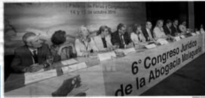
Clausura del congreso de abogados celebrado ayer en Marbella.

cho que se está celebrando en la Ciudad de la Justicia, centros de congresos, etcétera". Uno de los temas demandados para el próximo año es la necesidad de modernizar la oficina judicial