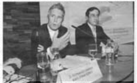
El juez Fernando Grande-Marlaska, este, junto al resto de los presentes, en el congreso.

El magistrado de la Audiencia Nacional Fernando Grande-Marlaska estrena el congreso jurídico