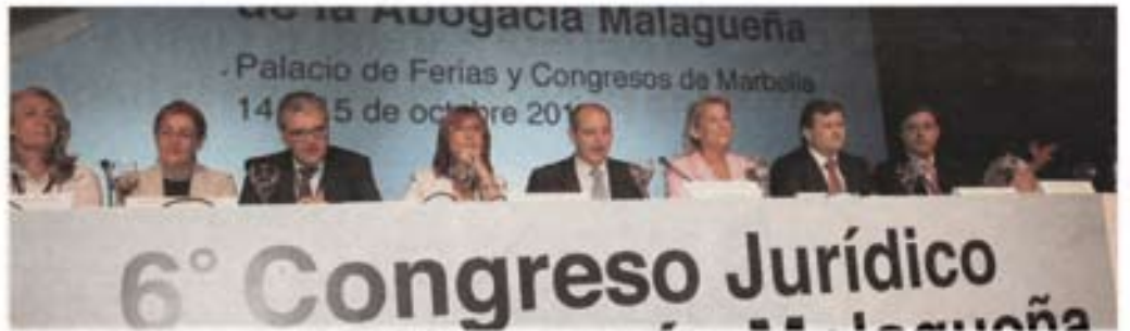
Mesa presidencial del acto de clausura del encuentro jurídico celebrado en el Palacio de Congresos de Marbella.