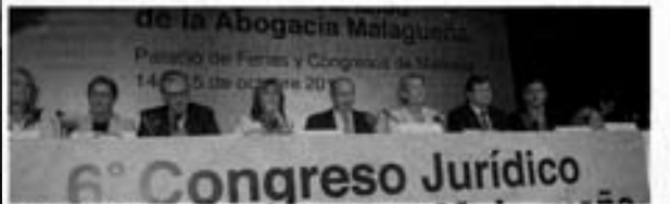
Mesa presidencial del acto de clausura del encuentro jurídico celebrado, que en el Palacio de Congresos de Marbella. JAMES LORRA

No siempre se ve a los abogados en los despachos. La mayoría de ellos, los que están en los despachos, son los que están en los despachos. La mayoría de ellos, los que están en los despachos, son los que están en los despachos. La mayoría de ellos, los que están en los despachos, son los que están en los despachos.